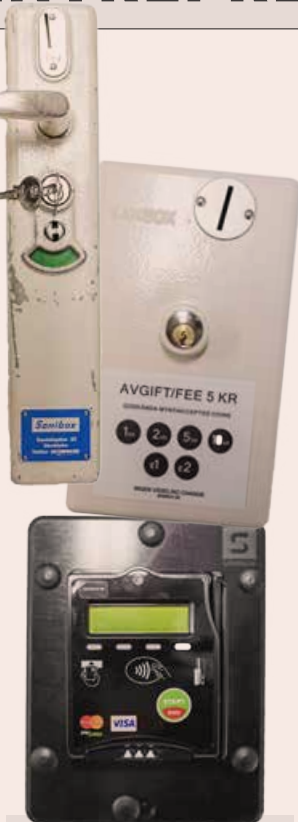
TRE EPOKER. Sanibox har tillverkat myntautomater i snart 70 år. Tekniken lik-som mynten förändras.